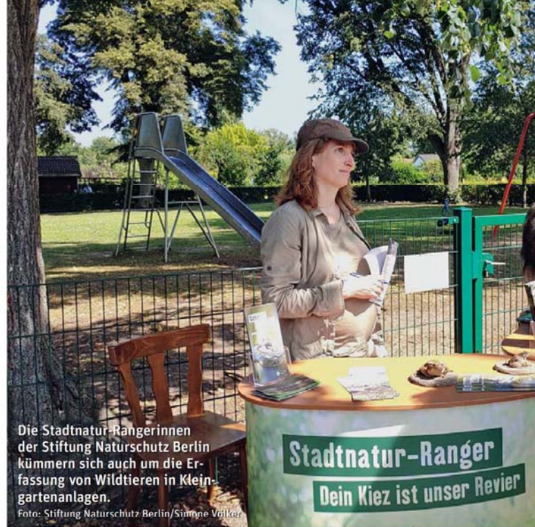
Die Stadtnatur-Rangerinnen der Stiftung Naturschutz Berlin kümmern sich auch um die Erfassung von Wildtieren in Kleingartenanlagen.

Zwischen März und August des letzten Jahres haben wir die Kleingärtnerinnen und Kleingärtner dazu aufgerufen, in ihren Parzellen nach Amphibien Ausschau zu halten, die Tiere mit Hilfe eines Beobachtungsbogens zu bestimmen und uns ihre erhobenen Daten zur Verfügung zu stellen. Begleitend waren wir in diesem Zeitraum jeden Monat ein ganzes Wochenende mit einem Informationsstand vor Ort in der Kolonie, um Fragen der Gartenfreunde zu beantworten und sie beim Ausfüllen der Beobachtungsbögen zu unterstützen.