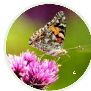
Distelfalter wandern jedes Jahr im Sommer ein und bilden eine weitere Generation