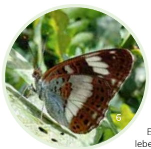
Ein seltener Gast: Der Kleine Eisvogel. Die Raupen leben an Heckenkirsche, Geißblatt und Schneebeere