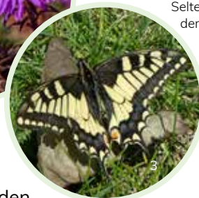
Selten geworden: der Schwalben- schwanz