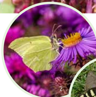
Häufiger Gartengast: Zitronenfalter. Bei dieser Art überwintert der Falter

» Hilltopping: Manche Arten treffen sich zur Paarung an auffälligen Erhebungen wie Hügeln oder Einzelbäumen (z. B. der Schwalbenschwanz).