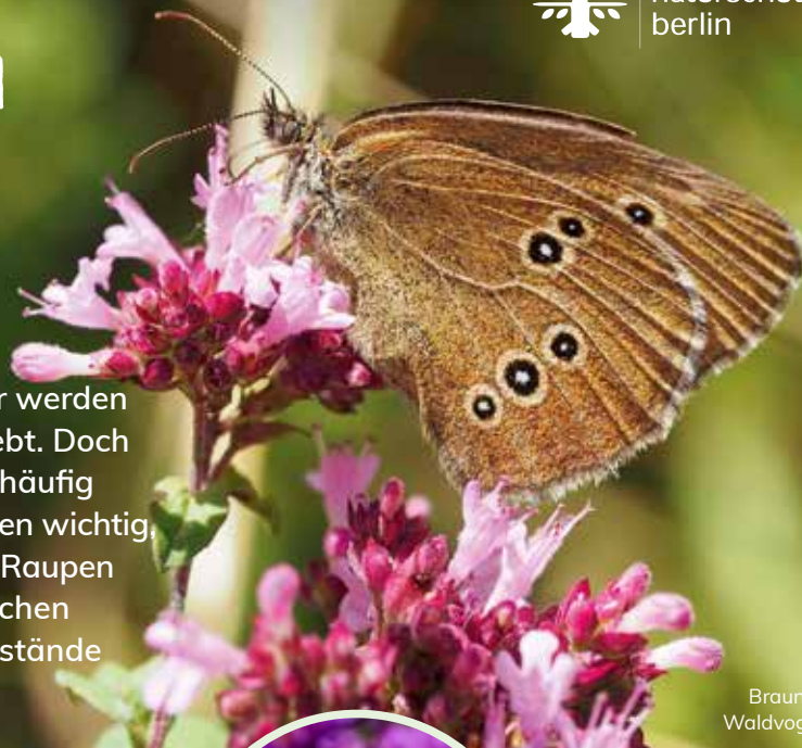
Brauner Waldvogel 1

Farbenfroh, schillernd oder gar silbern – Tagfalter werden für ihre vielfältige Schönheit bewundert und geliebt. Doch der Weg zum ausgewachsenen Falter bleibt uns häufig verborgen. In ihrer Entwicklung sind nicht nur Blüten wichtig, auch Futterpflanzen und Verstecke spielen für die Raupen und Puppen eine große Rolle. Leider sind inzwischen etwa 40% der Tagfalter gefährdet – auch die Bestände häufiger Arten befinden sich im Sinkflug.