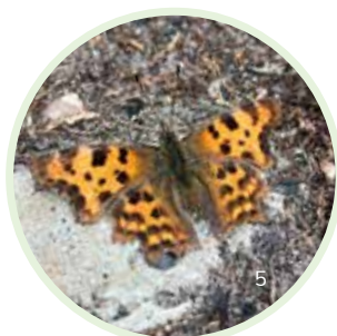
C-Falter sitzen gerne an Fallobst